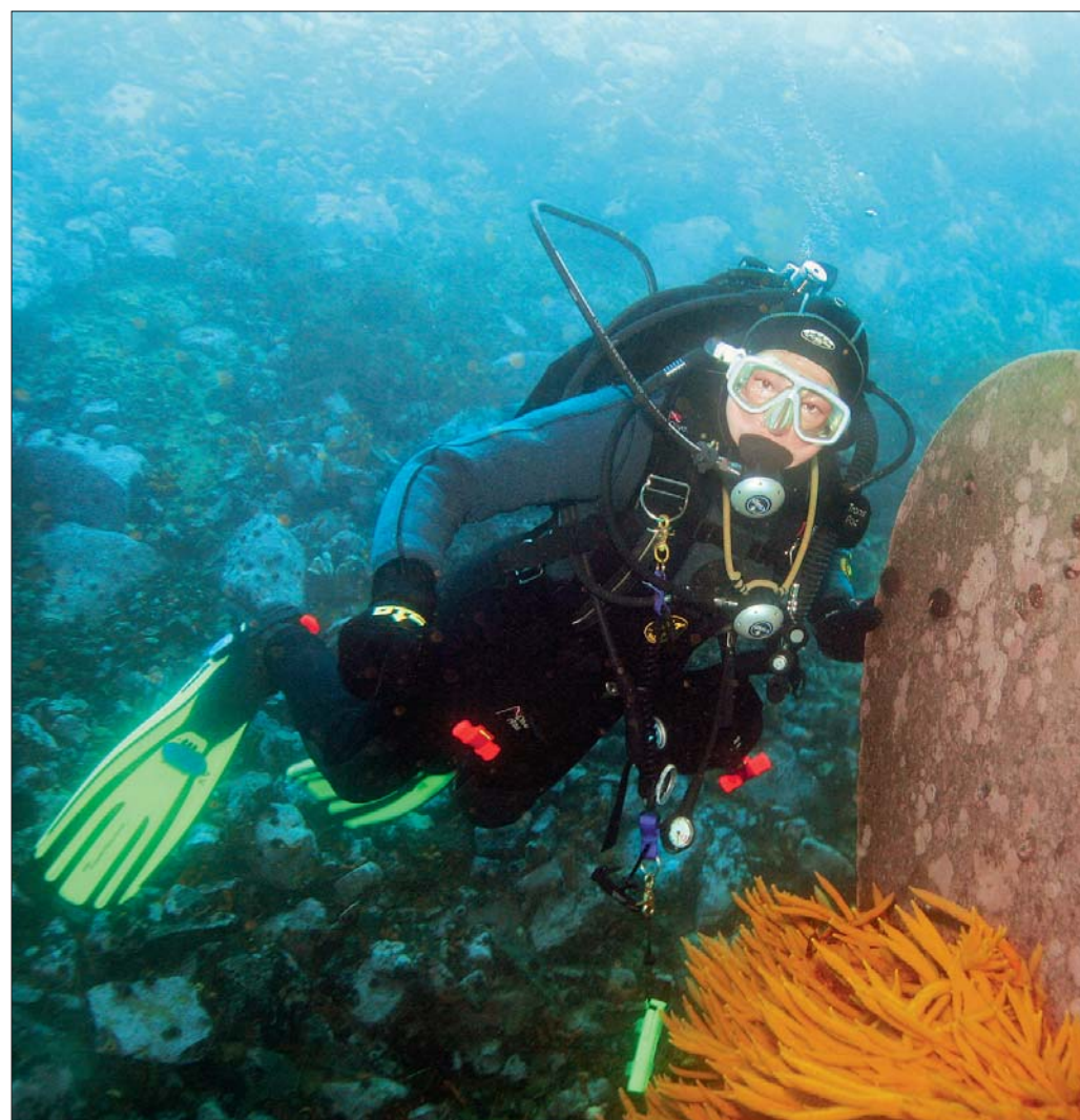
Ариэль, Губка Боб, Немо! Где вы?

В конце весны у многих из нас появляется неотвратимое желание залечь на дно. Нет, эта статья не о том, как укрыться от налоговой и военкомата, мы расскажем о законопослушном развлечении — дайвинге. Текст Ильи Ефимова