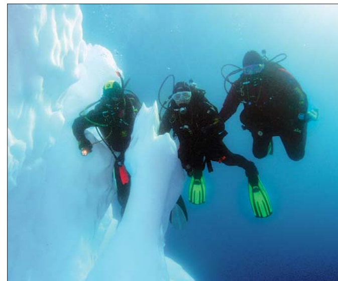
Этот лед придуман для отважных