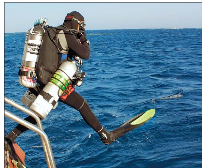
По воде аки посуху

Как ни странно, любимые маршруты дайверов-москвичей совпадают с любимыми маршрутами просто москвичей. Самое массовое направление — Египет. Популярность объясняется оптимальным соотношением цена — качество. Дальше идут Кокос, Галапагосы, Палау, Мальдивы и прочие океанические острова. Не стоит волноваться за то, что, ныряя в теплом зарубежном море, под водой ваши жесты, заученные в России, не поймут. Знаки едины для всех стран. Под водой во всем мире царит полное молчаливое